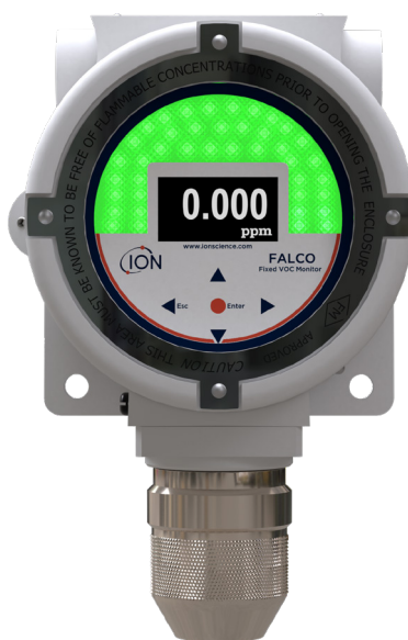
Modelo de 10,6 eV difuso

Registre su producto en línea en el plazo de un mes tras su compra para aumentar su garantía. Visite ION Science.