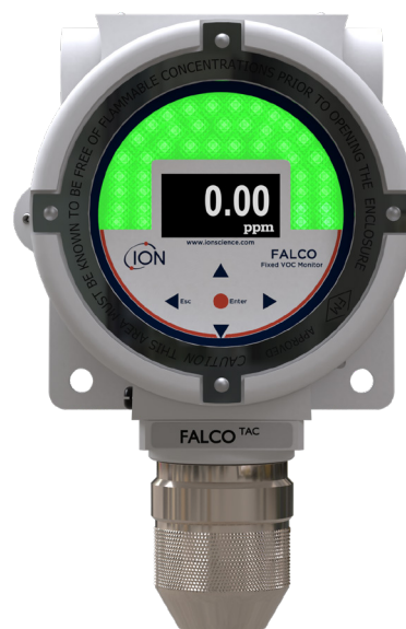
Modelo TAC difuso (10.0eV)